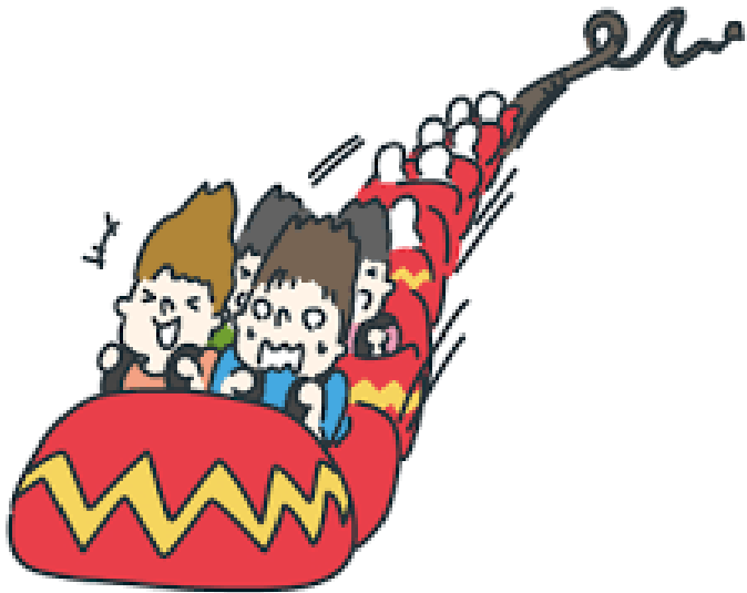
①ジェットコースター